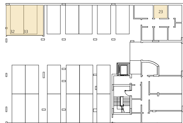
Piso -1 | Box - 33,21m 2 | Parqueamento N°32 e N°33 Arrecadação N°23 - 5,17m 2